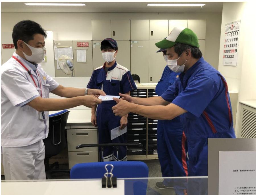
営業所長がドライバー1人ひとりに直接手渡しました